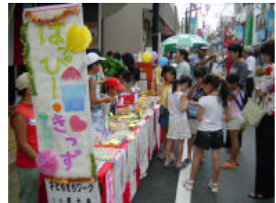
[子どもワークショップの様子(駄菓子屋OPEN)H17.8月]